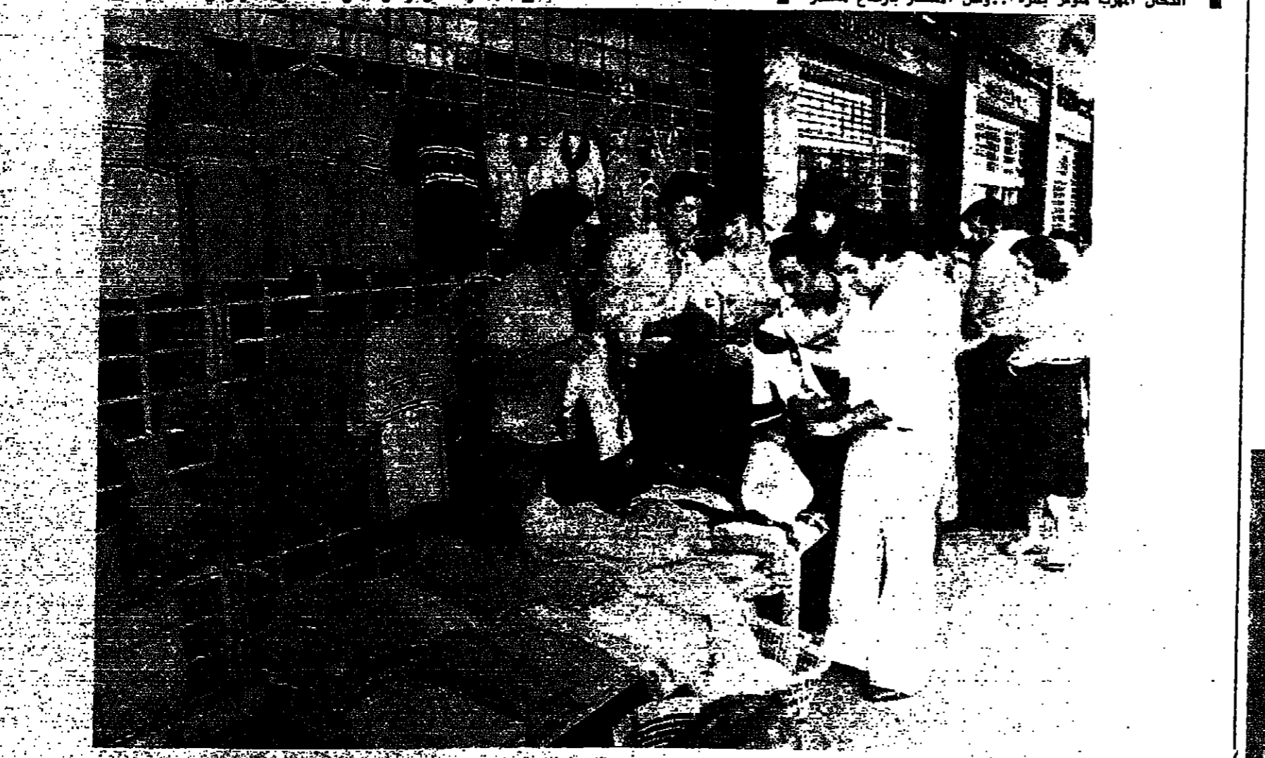
البسة في الحمراء .. والاسواق نشطة